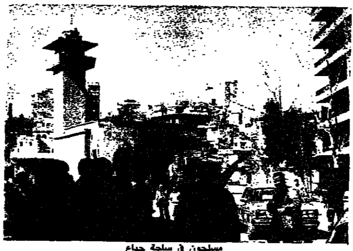
مسلحون في ساحة جبايع